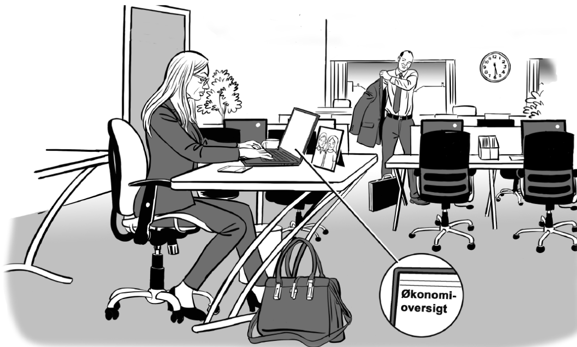
Illustration: Niels Roland