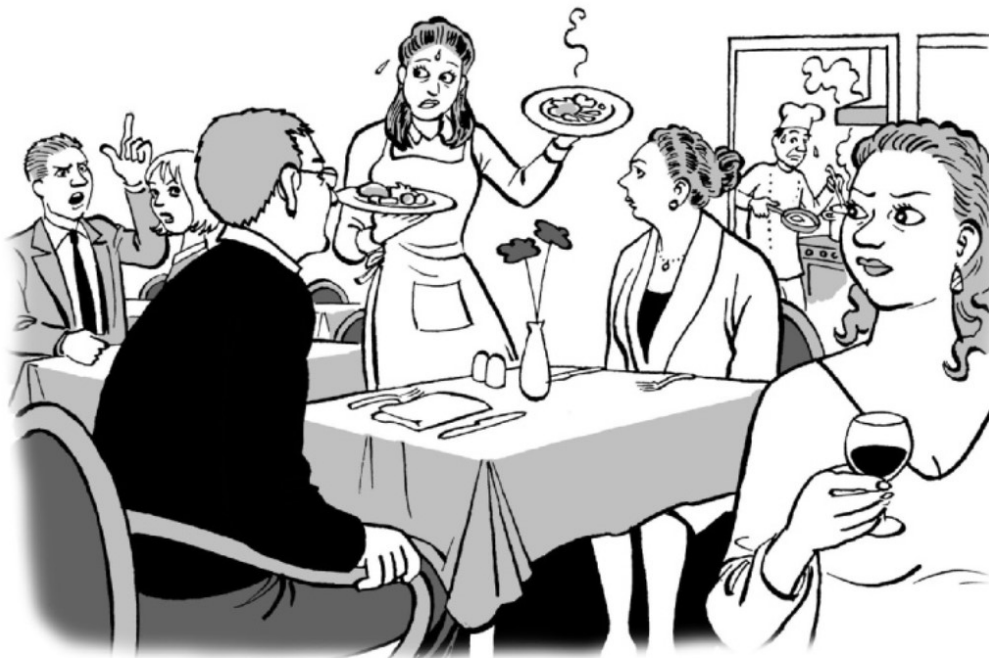
Illustration: Niels Roland MAJ-JUNI 2013